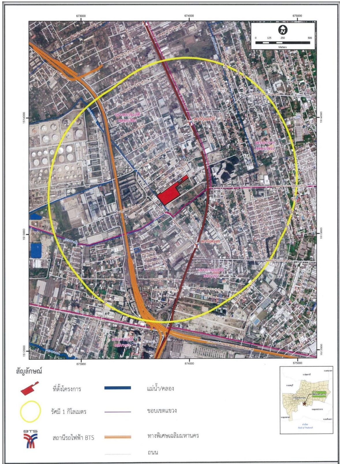
รูปที่ 1-1 ที่ตั้งโครงการ