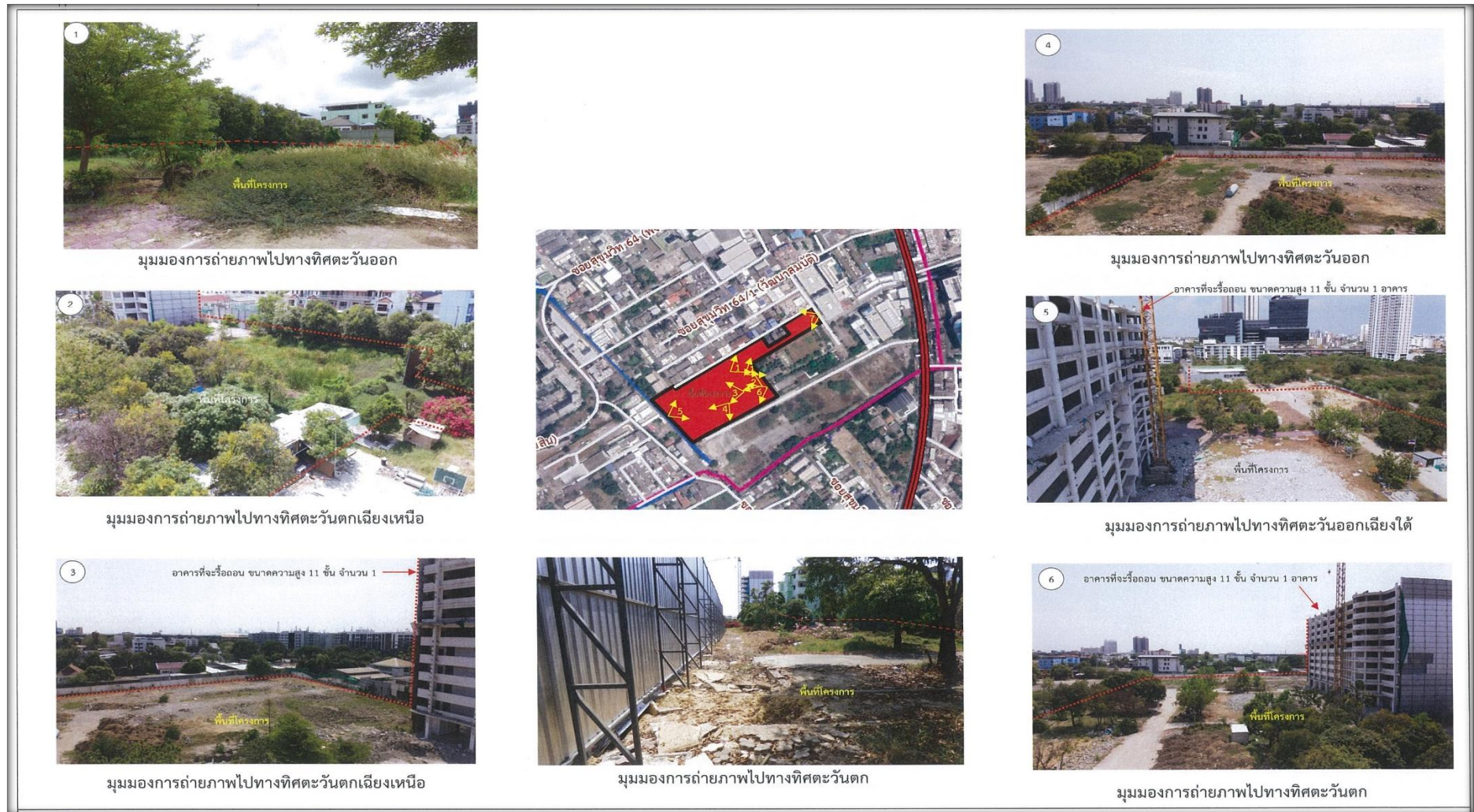
รูปที่ 1-2 อาณาเขตติดต่อโดยรอบ