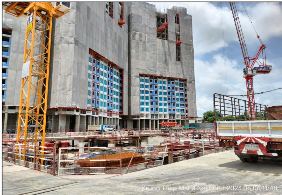
รูปที่ 1-4 กิจกรรมการก่อสร้างและสภาพปัจจุบันของโครงการ